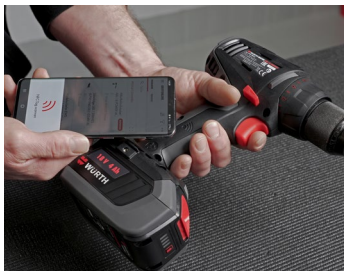
Werkzeuge und Maschinen